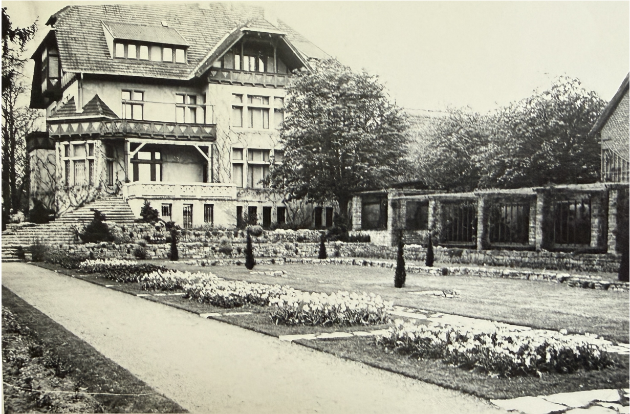
Das Kavaliershaus (Rückseite mit Garten)

Die „tolle Truppe“ bestand aus Resten von Wehrmachts- und SS-Einheiten, die vor der Roten Armee flohen. Das Dorf Dobbin war dem Reichsleiter der SS Himmler bekannt als Alterssitz des ehemaligen Shell-Magnaten Henri Deterding und seiner deutschen Familie. Hermann Göring war auch in den Wäldern um Dobbin oft zur Jagd.